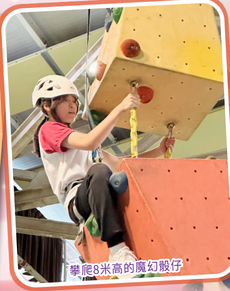
攀爬8米高的魔幻毆仔

睡眠不足不僅會讓同學精神不好，還會深深影響心理健康，引發各種負面情緒，如：容易煩躁、情緒起伏，注意力難以集中。若長期睡眠不足，就像背上了「睡眠負債」，累積下來不只讓人感到疲憊、心情低落、專注力下降，甚至還會影響體重、免疫力與運動表現。所以好好睡覺，不只是一天的事，而是照顧好身心健康的溫柔開始。願我們都能擁有安穩的睡眠，醒來時，身心都輕盈明亮。