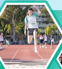
跳遠項目的凌空精彩瞬間