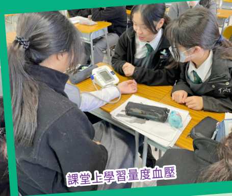
課堂上學習量度血壓