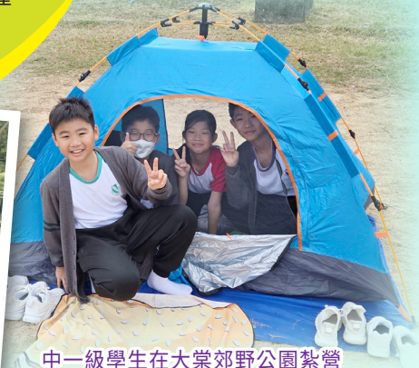
中一級學生在大棠郊野公園紮營