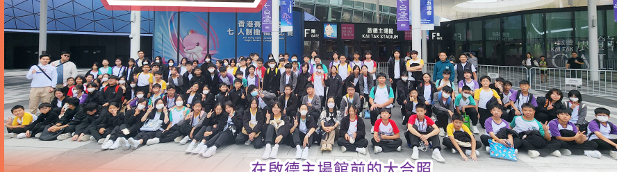
在啟德主場館前的大合照