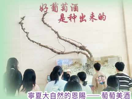
寧夏大自然的恩賜——葡萄美酒