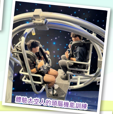
體驗太空人的頭腦機能訓練

透過實地參訪與反思討論，學生不僅拓展了視野，更研習了國家綜合國力及人民生活素質的提升。同學對文化傳承、城市創新與創意實踐的深入觀察，深刻體會到改革開放後國家的轉變。