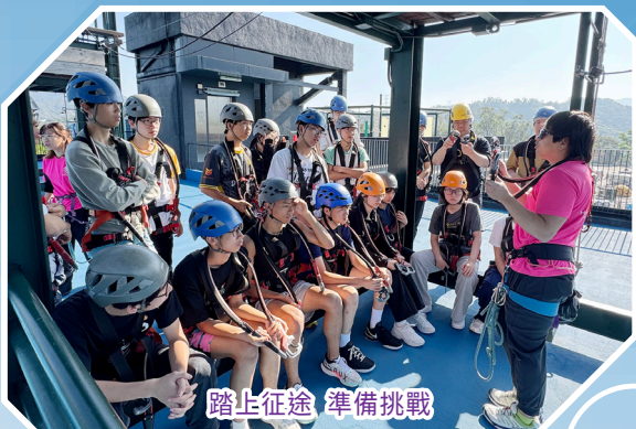
踏上征途 準備挑戰

為培育學生守法精神及正面價值觀，訓導組於上學期舉辦領袖生就職典禮、正向思維講座、秩序比賽等活動，並透過教育劇場傳遞尊重與包容，深化反欺凌訊息；反吸煙工作坊協助學生掌握辨識與拒絕技巧；領袖訓練營則藉歷奇活動及團隊任務，激發學生潛能，建立「不放棄任何一個人」的合作精神。各項訓育工作不僅帶動校園正向守規文化，更引領學生實踐良好品格，共建和諧校園。