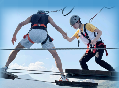
「友」你「友」我共歷難關