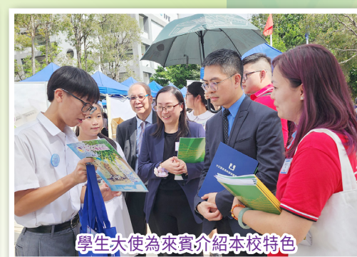
學生大使為來賓介紹本校特色