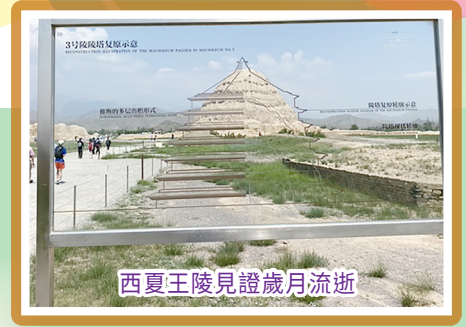
西夏王陵見證歲月流逝

沙湖的渡船碼頭左金沙萬畝閃爍，而右蘆葦碧波輕搖。西夏王陵風化的夯土墩、出土的古代陶器、青銅器印証了西夏王朝的輝煌。釀酒廠、乳製品廠、枸杞廠目不暇給的土產印証寧夏這片淨土將最原始的大自然恩賜，轉化成人們的養分。與姊妹學校銀川唐徠中學師生互訴衷心，分享彼此校園生活的點滴，讓這趟寧夏旅程的往日的歷史痕跡與淳樸的風土人情，成為我們一段不可磨滅的美好回憶。