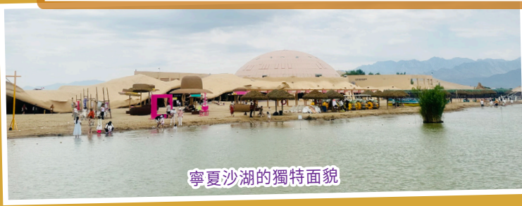
寧夏沙湖的獨特面貌