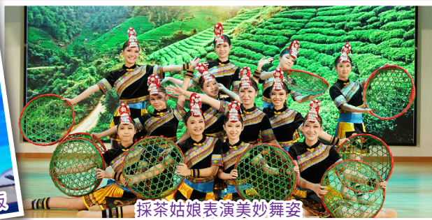
採茶姑娘表演美妙舞姿