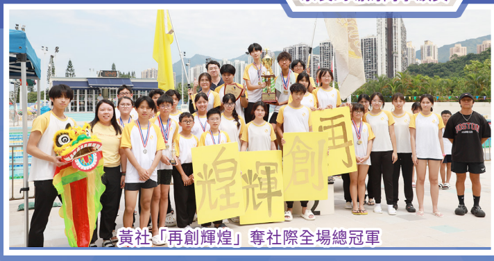
黃社「再創輝煌」奪社際全場總冠軍