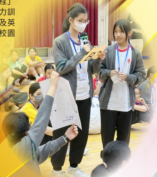
同學分享活動感受