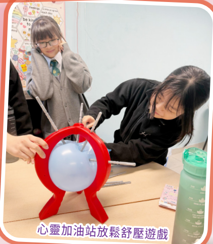
心靈加油站放鬆舒壓遊戲