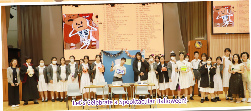
Let's Celebrate a Spooktacular Halloween!