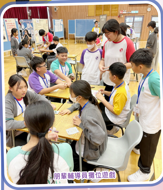
朋輩輔導員攤位遊戲