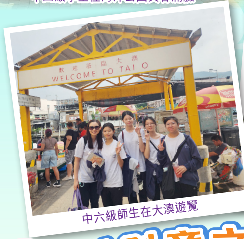
中六級師生在大澳遊覽