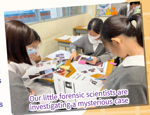
Our little forensic scientists are investigating a mysterious case