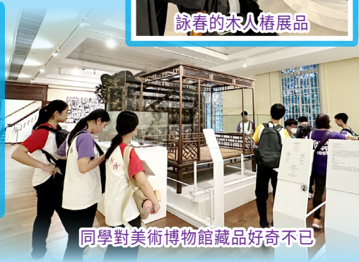
同學對美術博物館藏品好奇不已