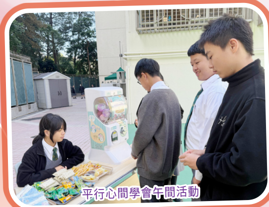
平行心間學會午間活動

輔導組陪伴同學於新學年積極應對各項挑戰。總朋輩輔導員在授章儀式上作去年和本年的工作簡介，充分體現了朋輩輔導員團隊的承先啟後精神。亦在校內為朋輩輔導員提供培訓工作坊，學習「善意溝通」技巧。此外，「學生守護大使」計劃擴充至中一至中六各班職務之中，於各班開展一系列推廣精神健康的活動。「賽馬會平行心間（校園版）」計劃則成立「平行心間學會」，舉辦「身心健康自我管理課程」以及訓練「身心健康大使」。輔導組將繼續以多元活動，與同學攜手共建關愛並充滿支援的校園環境。