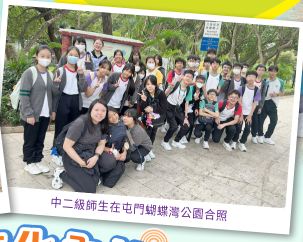
中二級師生在屯門蝴蝶灣公園合照