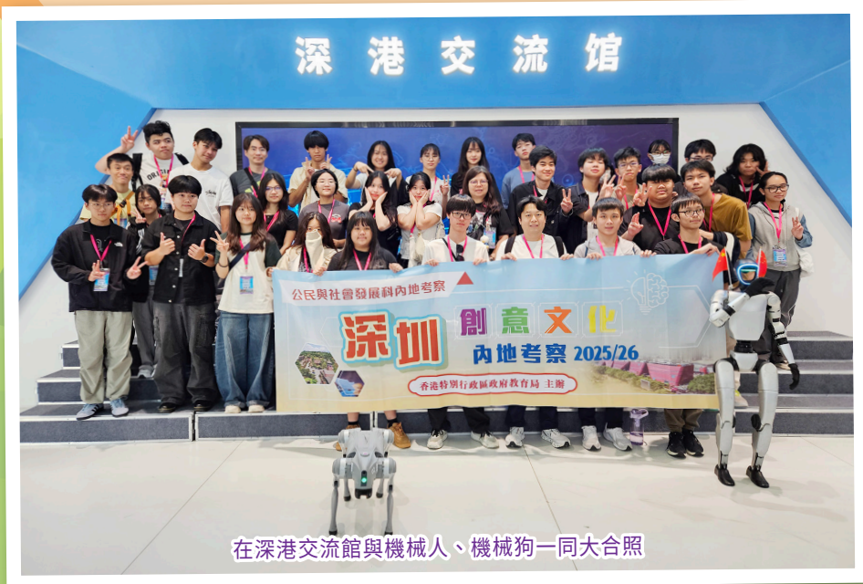
在深港交流館與機械人、機械狗一同大合照