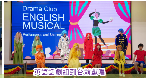
英語話劇組到台前獻唱