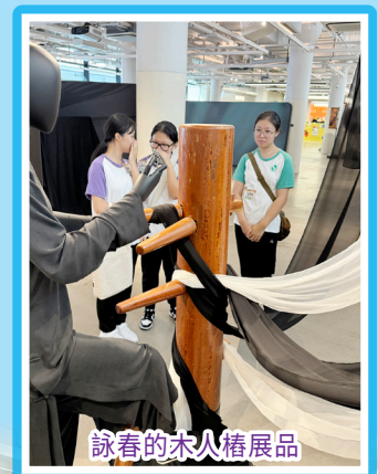
詠春的木人椿展品

新來港學生十月中旬參加「港島一日遊」活動，在領隊的導賞下首先遊覽中環街市，適逢「廿一廿十·中華文化節2025」的重點項目「華衣·武藝」在此展出，同學不但認識了香港保育、活化歷史建築物的概念和實踐，也感受到中華武術之剛勁與華服之柔美。其後同學前往香港大學，參觀香港現存歷史最悠久的美術博物館，對館內的青銅與陶瓷等文物和藝術品深感興趣。另一行程PMQ元創方讓同學自由探索，同學對在現場舉辦的「韓國廣場2025週末節慶」雀躍不已，也在各樓層的小店流連忘返，體會到香港的創意設計文化。最後一站維港摩天輪為同學提供高空觀景體驗，可以欣賞香港獨特的維港景色，為旅程畫下圓滿的句號。