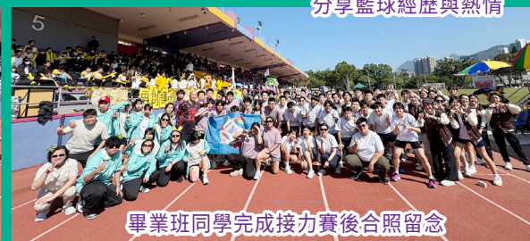
畢業班同學完成接力賽後合照留念