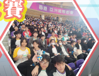
觀看七人制橄欖球賽事，同學們充滿喜悅