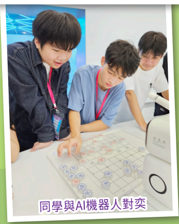
同學與AI機器人對奕