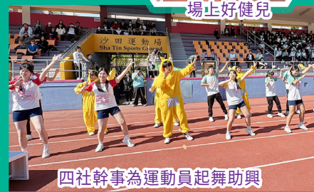
四社幹事為運動員起舞助興