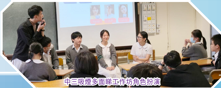
中三吸煙多面睇工作坊角色扮演