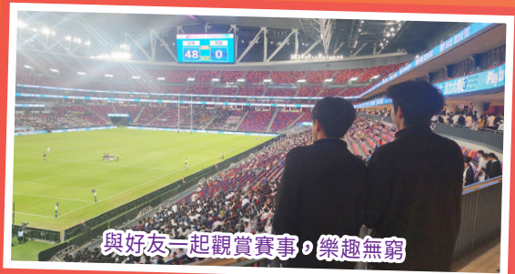
與好友一起觀賞賽事，樂趣無窮