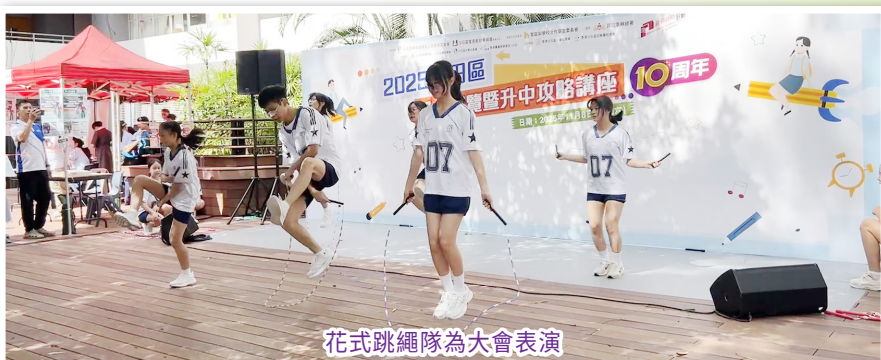
花式跳繩隊為大會表演