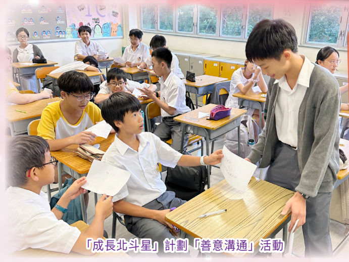
「成長北斗星」計劃「善意溝通」活動