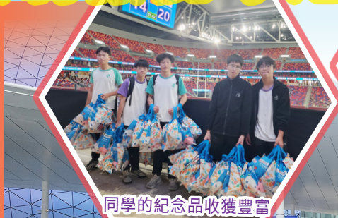
同學的紀念品收獲豐富

同學們在啟德主場館觀賞全運會七人制橄欖球比賽，全程投入於此項盛事中。他們全力以赴為運動員打氣，現場氣氛熱烈。現場特別設置賽規解說廣播，讓首次接觸此運動的同學更好地理解比賽規則，提升了大家的觀賽體驗。此外，同學們還獲得了全運會的紀念品，成為是次活動珍貴的回憶。