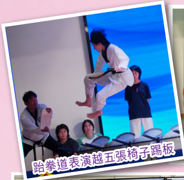
跆拳道表演越五張椅子踢板