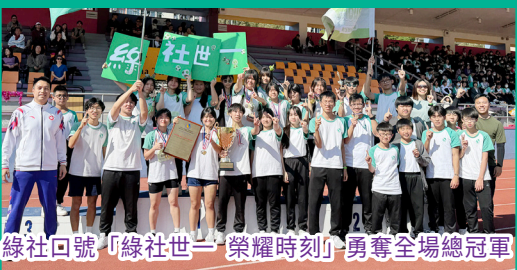
綠社口號「綠社世一 榮耀時刻」勇奪全場總冠軍