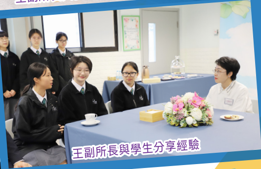
王副所長與學生分享經驗