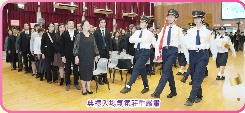
典禮入場氣氛莊重肅肅