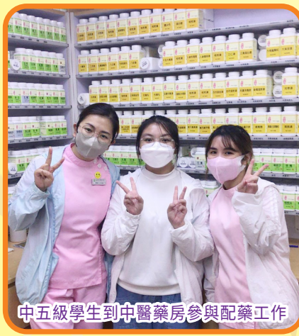
中五級學生到中醫藥房參與配藥工作