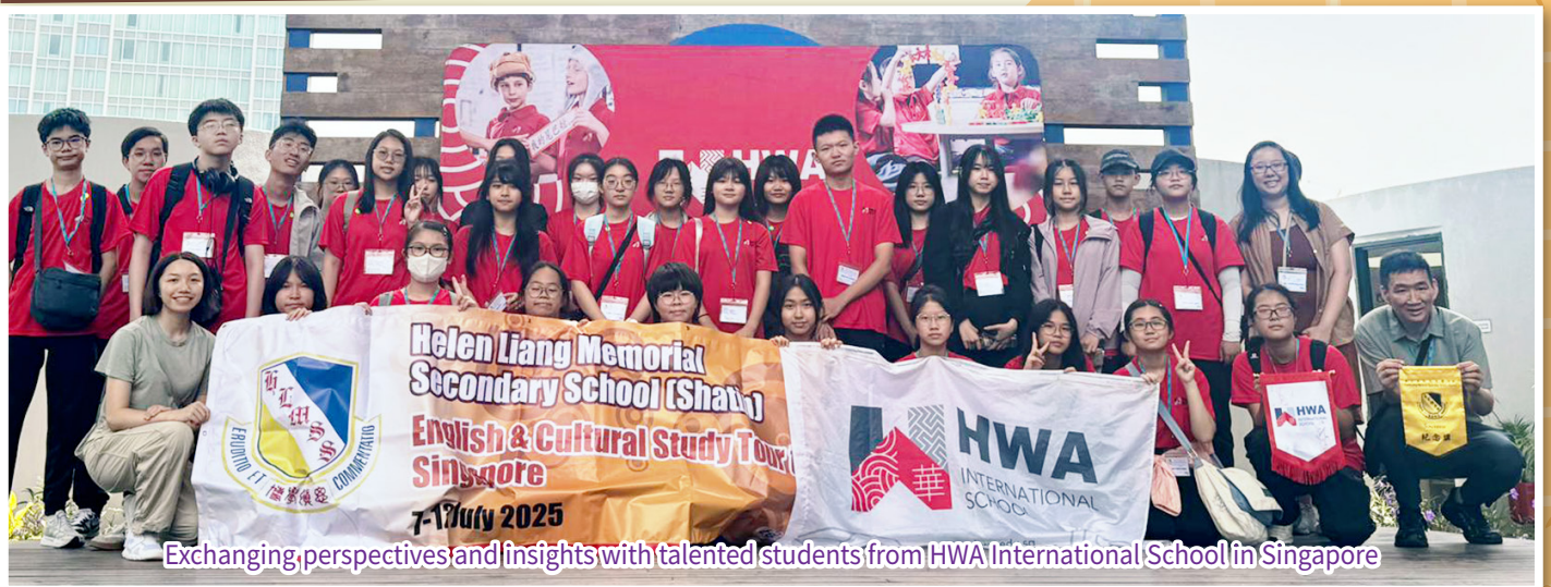
Exchanging perspectives and insights with talented students from HWA International School in Singapore