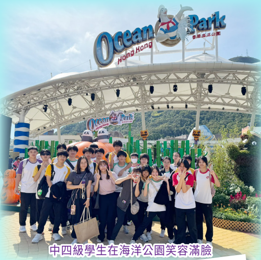
中四級學生在海洋公園笑容滿臉

在10月31日的學校全方位學習日，各級學生參與了豐富多彩的活動，讓學習生活充滿愉快回憶。中一和中二學生享受燒烤與野餐，親近自然；中三學生則踏上深圳藝術文化探索之旅；中四學生在海洋公園玩盡各種刺激的機動遊戲；中五級則跟隨公社科進行內地考察；而中六學生則在大澳體驗島上的悠閒生活和獨特美食。此次全方位學習日不僅加強了師生之間的聯繫，也豐富了學生們的課外學習經歷。