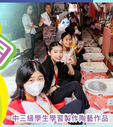
中三級學生學習製作陶藝作品