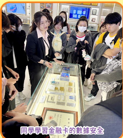
同學學習金融卡的數據安全

為協助同學探索職涯，生涯規劃組定期舉辦企業參訪、職場體驗及聯校博覽，以拓寬同學視野；並邀請大專院校與業界代表分享，提供最新升學就業情報。來年，生涯規劃組將重點加強對中三、中五及中六過渡期學生的貼身支援，透過增加職場體驗機會與個人化諮詢，陪伴同學以更穩健的步伐規劃未來。