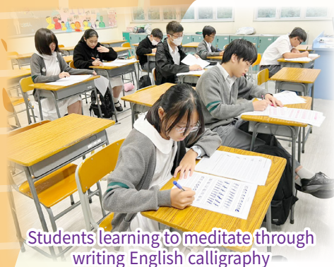
Students learning to meditate through writing English calligraphy

Who wouldn't be grateful to our school for the invaluable learning experiences related to the English language and reading?