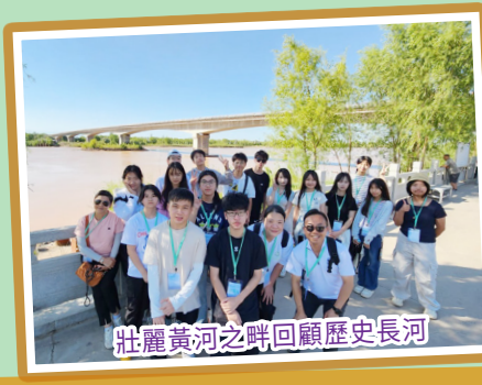
壯麗黃河之畔回顧歷史長河