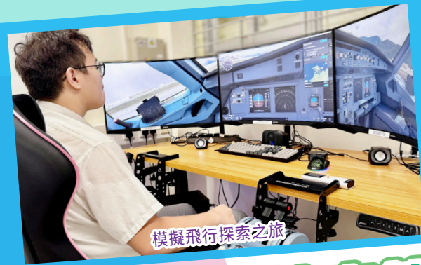
模擬飛行探索之旅