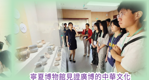
寧夏博物館見證廣博的中華文化