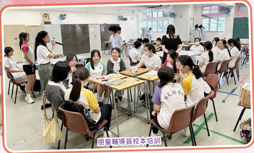
朋輩輔導員校本培訓