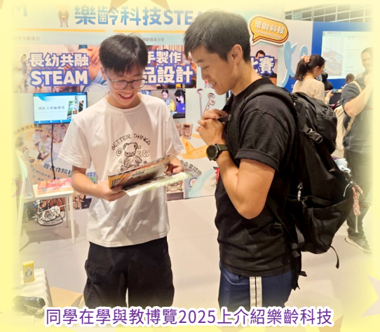
同學在學與教博覽2025上介紹樂齡科技