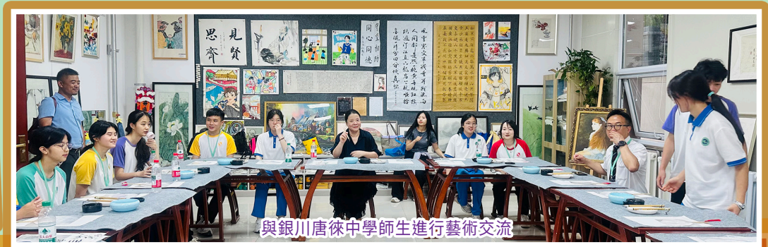
與銀川唐徠中學師生進行藝術交流