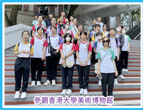
參觀香港大學美術博物館