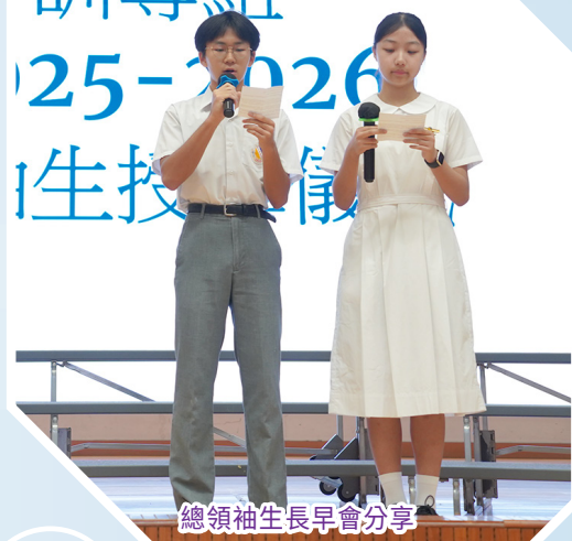
總領袖生長早會分享