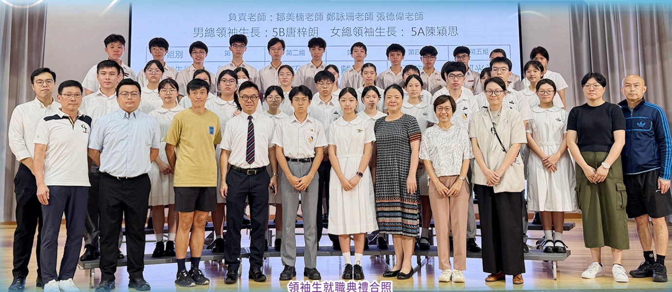
領袖生就職典禮合照