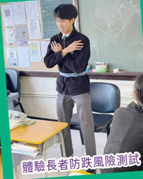
體驗長者防跌風險測試