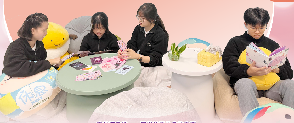
森林棲息地——同學放鬆休息的空間