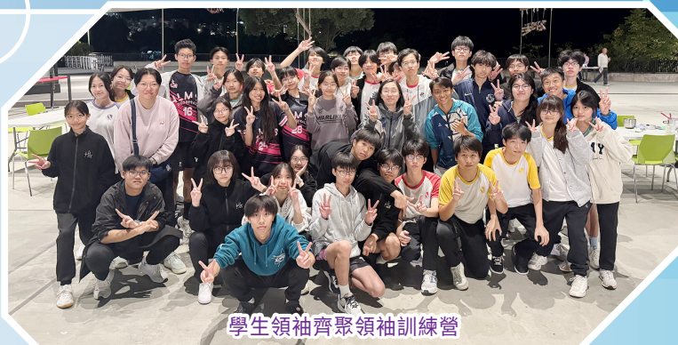
學生領袖齊聚領袖訓練營