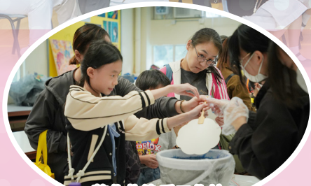
製作札染扇工作坊

本校中一入學資訊日圓滿舉行，近四百位嘉賓蒞臨，感受我院校園風彩。包括中樂、跳繩、舞蹈、跆拳道及英語話劇，近百學子以精湛演出展現追求卓越的精神。嘉賓踴躍參與各樓層的特色攤位，攀石、STEAM實驗、劍擊示範等人流絡繹不絕。