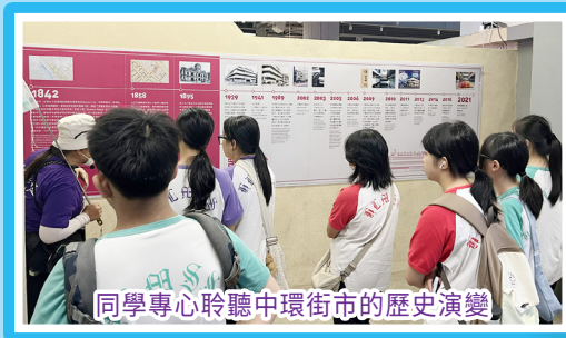
同學專心聆聽中環街市的歷史演變