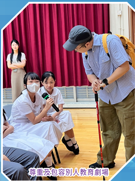
尊重及包容別人教育劇場