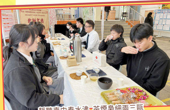
靜聽壺中春水沸 茶煙裊細兩三瓊