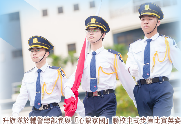
升旗隊於輔警總部參與「心繫家國」聯校中式步操比賽英姿

聯課活動組舉辦多元化課外活動，發掘學生的多元潛能。當中包括制服團隊及服務團隊，以培養學生團隊合作精神和社會責任感。本校安排中一學生按興趣參加不同制服團隊，如醫療輔助隊少年團、民安隊及升旗隊，透過恆常的步操訓練及活動，培養其自律性及正確價值觀。全校學生亦可透過公益少年團、扶輪少年服務團、少年警訊等服務團隊，參與義工服務和賣旗活動，培養學生服務社會之精神，並藉著回饋社會，明白助人為快樂之本的道理。