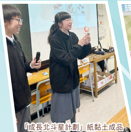
「成長北斗星計劃」紙黏土成品