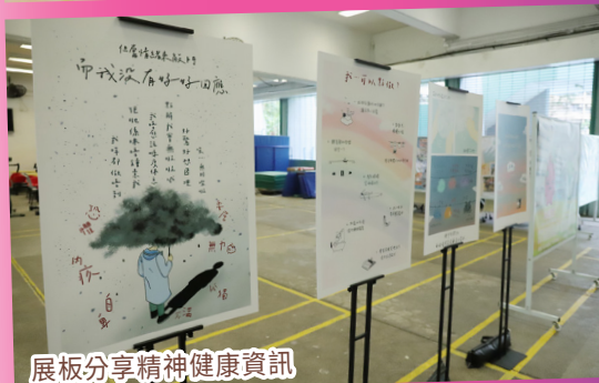
展板分享精神健康資訊