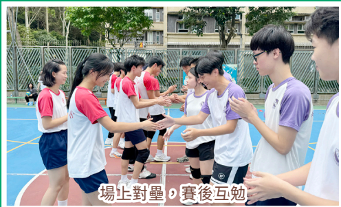
場止對壘，賽後互勉