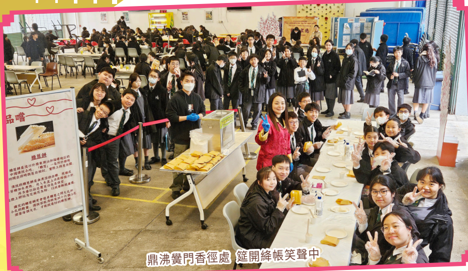
鼎沸覺門香徑處 筵開絳帳笑聲中