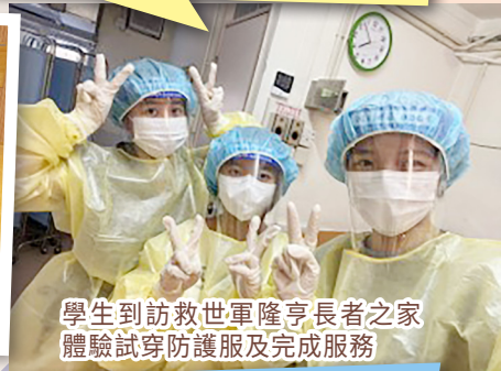
學生到訪救世軍隆亨長者之家體驗試穿防護服及完成服務