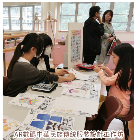
AR數碼中華民族傳統服裝設計工作坊