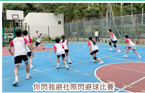
你閃我避社際閃避球比賽