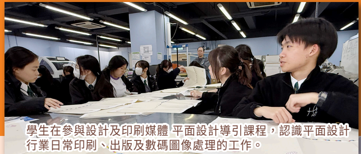
學生在參與設計及印刷媒體 平面設計導引課程，認識平面設計行業日常印刷、出版及數碼圖像處理的工作。