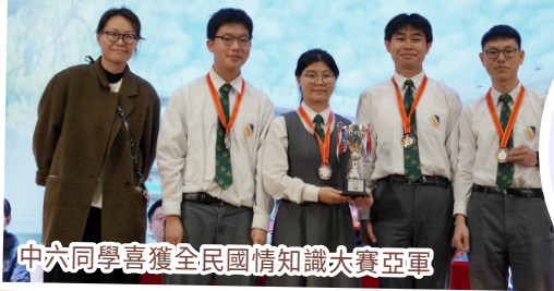
中六同學喜獲全國民情知識大賽亞軍