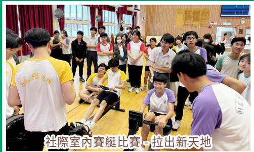
社際室內賽艇比賽，拉出新天地