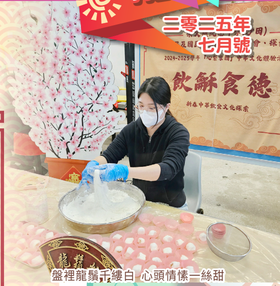
盤裡龍鬚千縷白 心頭情愫一絲甜