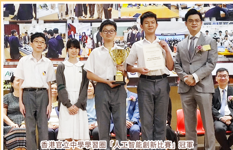
香港官立中學學習圈「人工智能創新比賽」冠軍