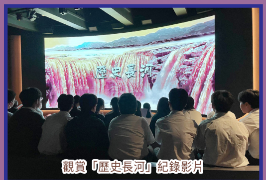
觀賞「歷史長河」紀錄影片