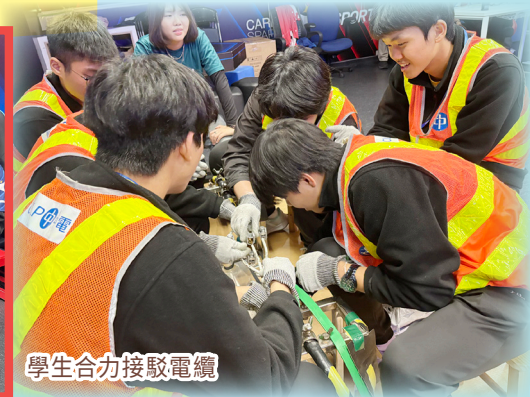
學生合力接駁電纜