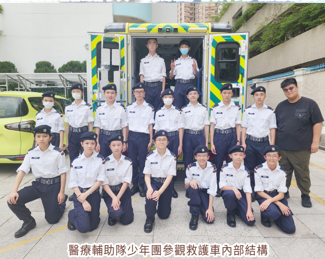
醫療輔助隊少年團參觀救護車內部結構