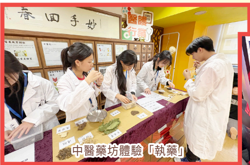
中醫藥坊體驗「執藥」