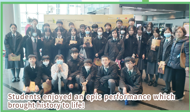
Students enjoyed an epic performance which brought history to life!

Our S.2 students took part in a series of activities themed around the Chinese classic Romance of the Three Kingdoms. Not only were they immersed in reading-related activities—ranging from a Meet-the-Author session and the Battle of the Books Competition to morning reading—but they also experienced a miraculous sensation while watching the stage play adapted from the novel. There was never a dull moment during the performance, and it was truly an eye-opener for our students, as it was so realistic that it transported them back in time to the era of the Three Kingdoms.