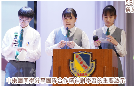
中樂團同學分享團隊合作精神對學習的重要啟示