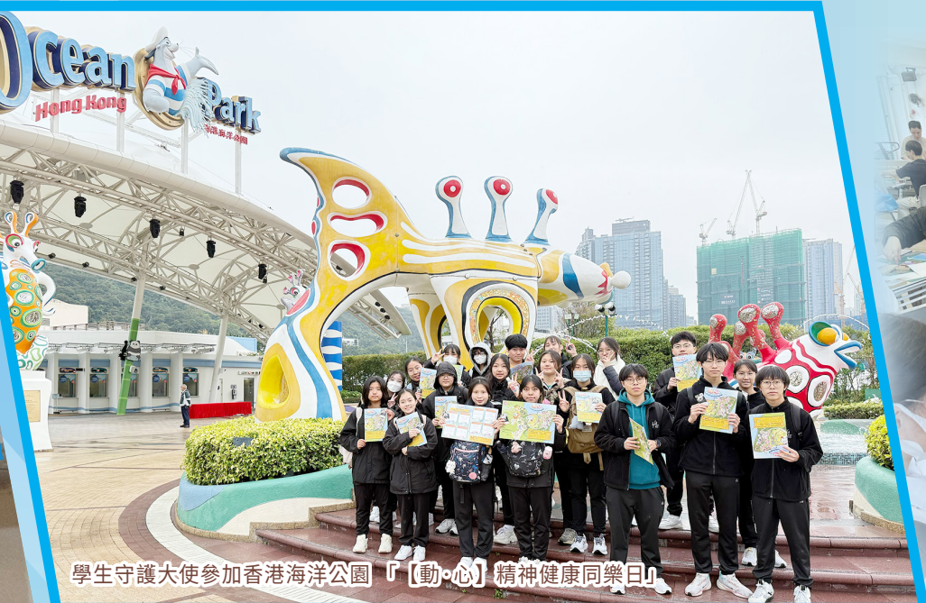
學生守護大使參加香港海洋公園「【動·心】精神健康同樂日」