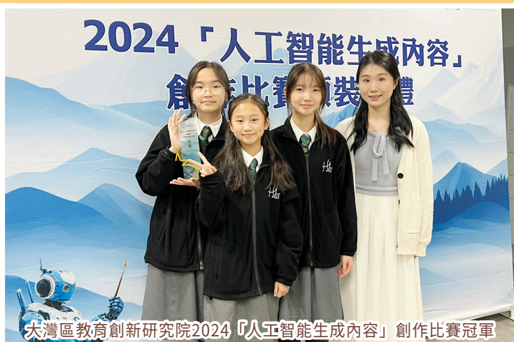
大灣區教育創新研究院2024「人工智能生成內容」創作比賽冠軍