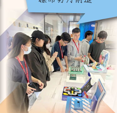
同學在廣東工業設計城了解最新的设计作品，及當地如何引進及培育工業設計高端人才