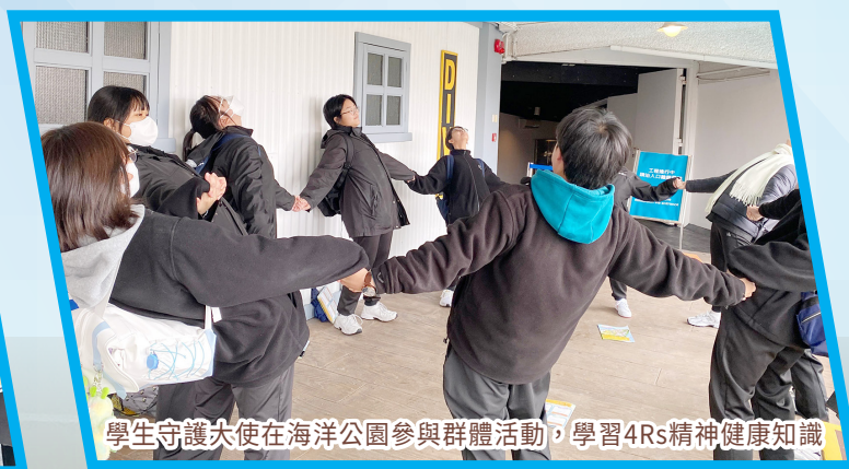
學生守護大使在海洋公園參與群體活動，學習4Rs精神健康知識