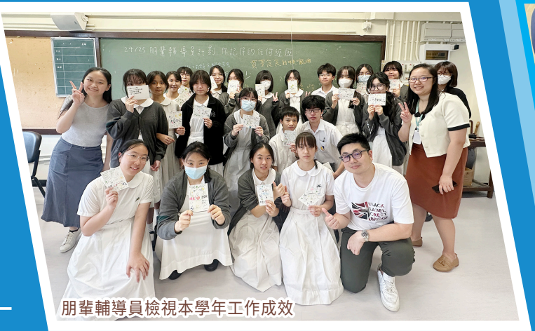
朋輩輔導員檢視本學年工作成效

輔導組致力營造互相關愛的校園氣氛，朋輩輔導員舉辦「歌聲傳感恩，孖蛋表謝意」活動；帶領中一同學在「成長北斗星」計劃中製作紙黏土模型；守護大使則設置攤位推廣精神健康。「擁抱情緒嘉年華」中，讓學生偷得浮生半日閒，暢玩各種遊戲的同時，欣賞輕鬆愉快的精彩話劇，亦能享用美食，從而放鬆身心。