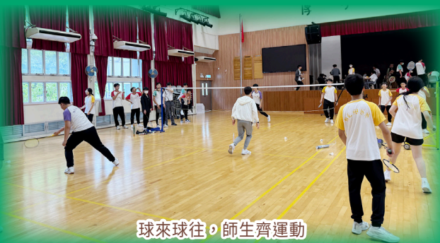
球來球往，師生齊運動

今年的運動周已是第四屆，師生自由地在小息、午膳等空餘時間相約到球場互相切磋球技，增進師生情誼之餘，亦促進同學間的友誼。同時，體育科與聯課活動組舉辦社際室內賽艇比賽及社際閃避球比賽，各社健兒及老師使出渾身解數，投入競賽為社爭取佳績。在做運動鍛鍊身體的過程中，同學學習到守規、體育精神、團隊精神，並在比賽間增進師生關係，讓大家建立活躍及健康的生活方式。