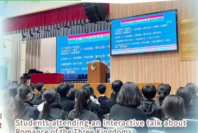
Students attending an interactive talk about Romance of the Three Kingdoms