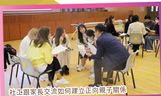
社工跟家長交流如何建立正向親子關係

家長日當天，在同學的細心協助下，一眾獲邀家長透過平板電腦或手提電話在「學校發展與問責」數據電子平台填寫問卷，藉以收集家長對學校的寶貴意見，協助學校製作表現評量參考數據，幫助學校準確評估校本的強、弱、機、危，達致最適合學生的學習效果。