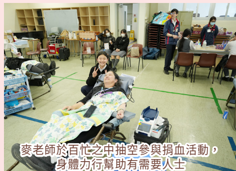
麥老師於百忙之中抽空參與捐血活動，身體力行幫助有需要人士