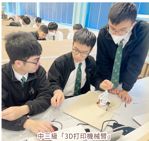
中三級「3D打印機械臂」