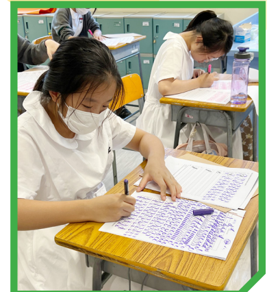
Unwinding and meditating through the English Calligraphy for Mindfulness Class