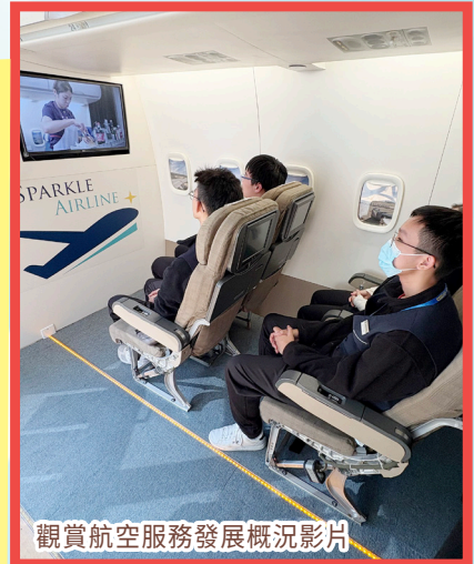
觀賞航空服務發展概況影片

活動後，中文科老師安排延伸學習，引導學生將體驗所得轉化為求職自薦信。這種跨科組協作的教學模式，不僅強化學生的職場認知，更讓語文學習與現實生活緊密結合，有效提升學習動機與實用性。同學在活動後反思，在是次活動中認識到不同行業所需的能力，是很難得可貴的經驗。