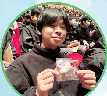
Thrilled student holding a special gift after aing a question about the drama show!