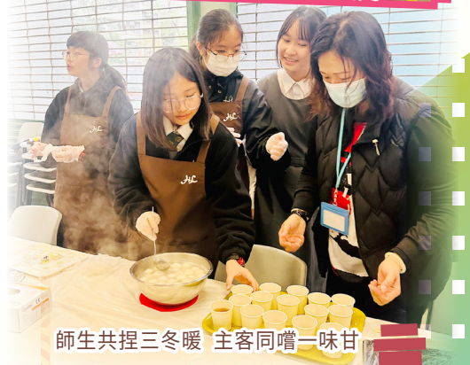
師生共捏三冬暖 主客同嚼一味甘