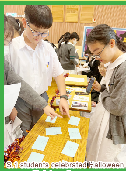
S.1 students celebrated Halloween with interactive games