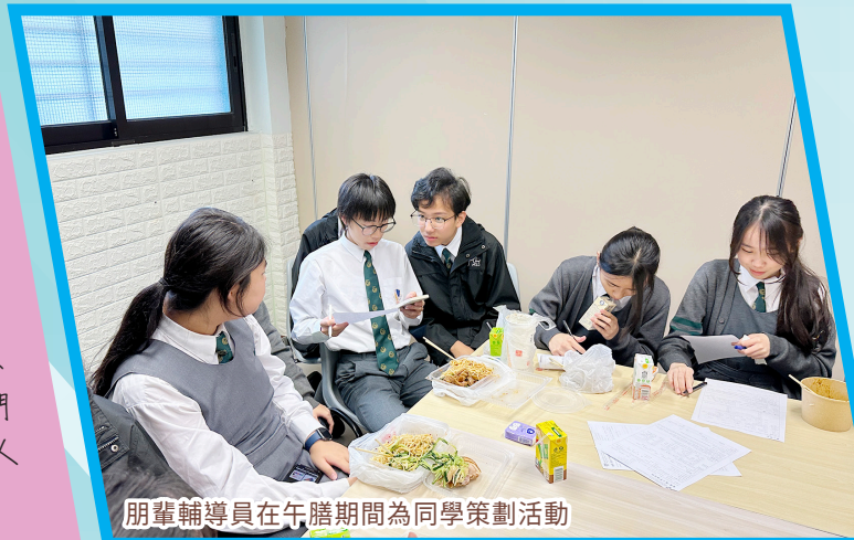
朋輩輔導員在午膳期間為同學策劃活動

我很感恩成為2024-2025年度的總朋輩輔導員。這段承載重任的旅程充滿着溫暖與歡笑，我永遠忘不了跟朋輩們一起並肩創造的美好校園回憶，也同時希望朋輩輔導員這一年來的工作受到大家的肯定。最後，我想勉勵大家，未來的路途上或許會迷茫，但別忘了，我們身邊還有很多人同行。朋輩間的鼓勵與支持，會跨越人與人之間的距離，繼續溫暖我們的校園。