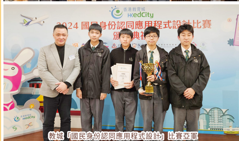
教城「國民身份認同應用程式設計」比賽亞軍