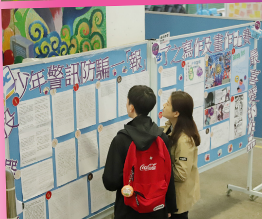
家長與子女一同了解校園生活點滴