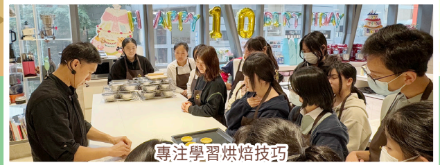
專注學習烘焙技巧

本學年約有六十位新來港學生加入梁文燕的大家庭，學校特意開設新來港學生支援組，協助同學適應校園生活、融入香港社會。在學校各科組同心協力下，同學一起學習誦唱校歌、參觀本地大學，認識學校願景及本港升學途徑；同時配合英文適應課程，鞏固學業的基礎，亦不忘舒緩身心，與家長、同窗好友及朋輩輔導員出席親子烘焙班、端午粽工作坊等，豐富校園生活。