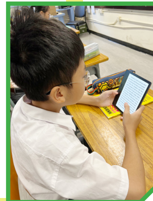
Reading anytime and anywhere is possible with e-reading