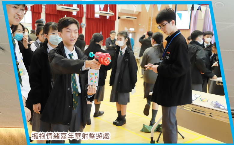
擁抱情緒嘉年華射擊遊戲