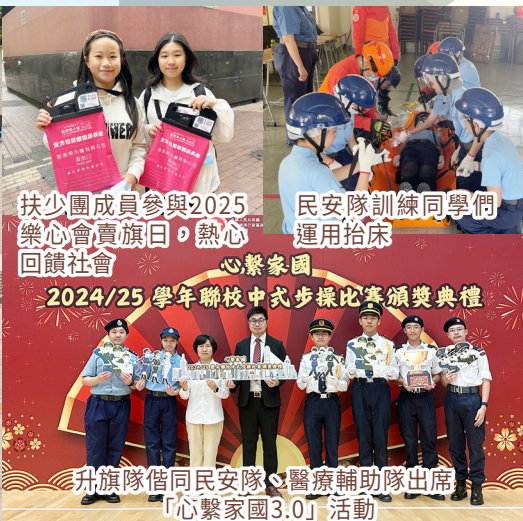
扶少團成員參與2025樂心會賣旗日，熱心回饋社會