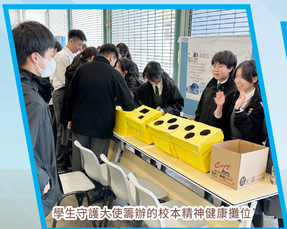
學生守護大使籌辦的校本精神健康攤位