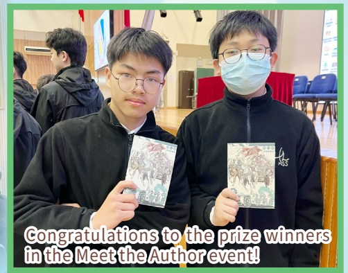
Congratulations to the prize winners in the Meet the Author event!