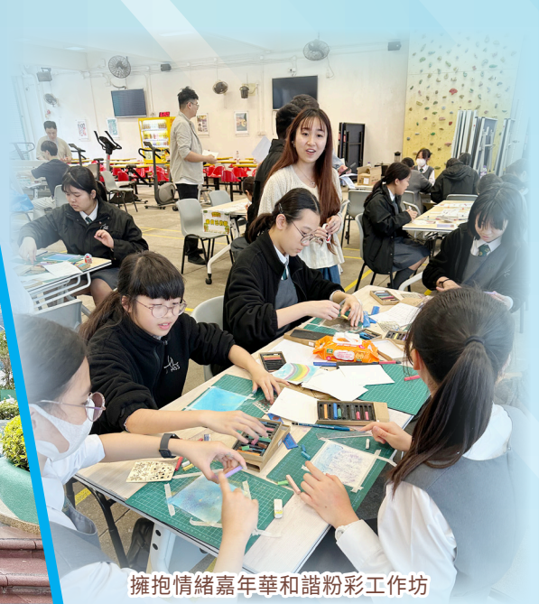
擁抱情緒嘉年華和諧粉彩工作坊