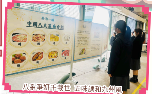
八系爭妍千載世 五味調和九州風