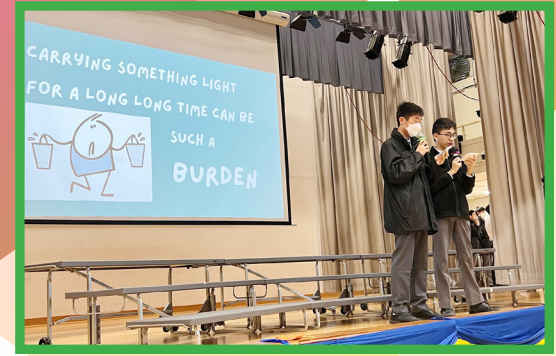
Students in charge of the English morning assemblies shared tips for relaxation with our students through engaging presentations

A reading culture has been cultivated, thanks to our Reading Ambassadors, who regularly shared interesting and meaningful books with their peers. With the help of e-books and e-reading devices, reading has never been so accessible and enjoyable!