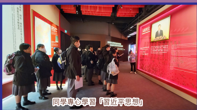
同學專心學習「習近平思想」

國家安全展覽廳是另一個參觀重點，同學跟從導賞員參觀，了解全民維護國家安全的重要性，加深對國家安全的認識。展覽廳介紹總體國家安全觀、愛國主義精神，帶出香港安全、社會穩定的現況，培育同學的愛國情懷，又鼓勵同學積極參與國家安全建設，提高良好公民意識和國民責任感。