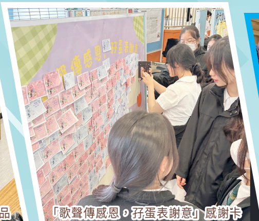
「歌聲傳感恩，孖蛋表謝意」感謝卡