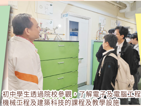
初中學生透過院校參觀，了解電子及電腦工程、機械工程及建築科技的課程及教學設施

參與長者日間中心服務後，我具體了解到護理員的日常工作，學會按長者身體狀況分配餐食，並注意餵食速度以防噎食。我在活動服務期間，透過主動溝通，學會懂得關心長者需求，收穫良多。