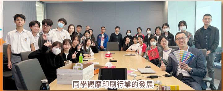
同學觀摩印刷行業的發展

針對高中同學職涯探索需求，本校積極規劃工作體驗活動、職場講座及大灣區職涯探索之旅等活動，以拓寬學生的職業視野，深化升學與就業規劃的具體認知。