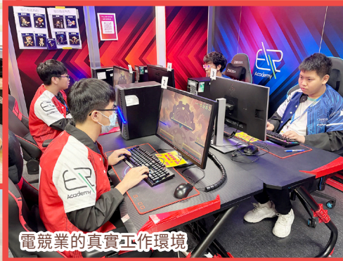
電競業的真實工作環境