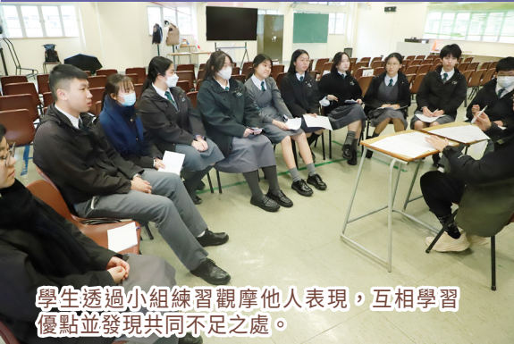
學生透過小組練習觀摩他人表現，互相學習優點並發現共同不足之處。

學生在工作坊提前熟悉面試流程，透過即時反饋與交流，有效提升應對技巧與自信心，為升學之路奠定堅實基礎。