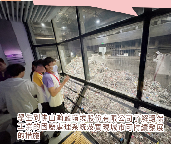
學生到佛山瀚藍環境股份有限公司了解環保工業的固廢處理系統及實現城市可持續發展的措施

參觀「羅浮宮國際家具博覽中心」後，我瞭解到不同材質的特點和各類人群的需求，對傢俱設計及室內裝飾行業產生了濃厚興趣。未來我會持續充實自己，朝著這個專業領域的目標而努力前進。