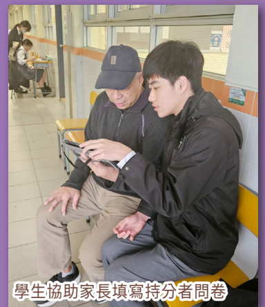
學生協助家長填寫持分者問卷