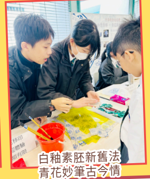
白釉素胚新舊法 青花筆箋古今情