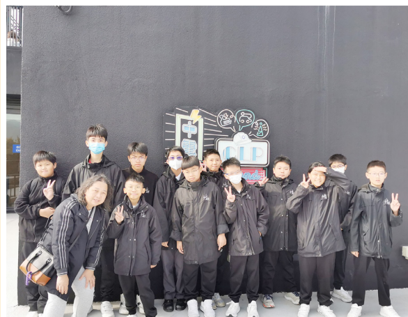
中電校園工程師計劃E-Playground學習運輸電力的科學原理