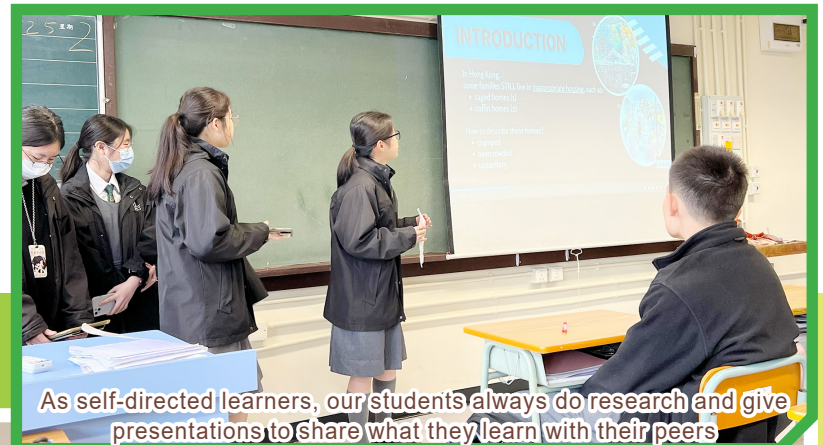
As self-directed learners, our students always do research and give presentations to share what they learn with their peers