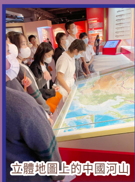
立體地圖上的中國河山