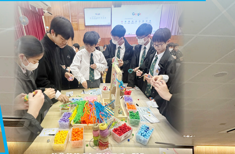
擁抱情緒嘉年華減壓手工製作