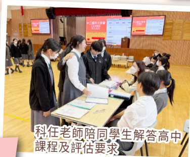
科任老師陪同學生解答高中課程及評估要求