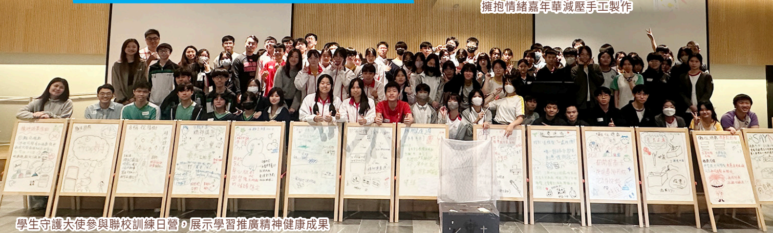
學生守護大使參與聯校訓練日營，展示學習推廣精神健康成果