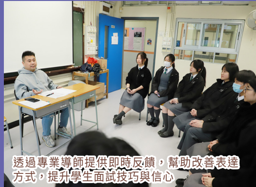
透過專業導師提供即時反饋，幫助改善表達方式，提升學生面試技巧與信心。