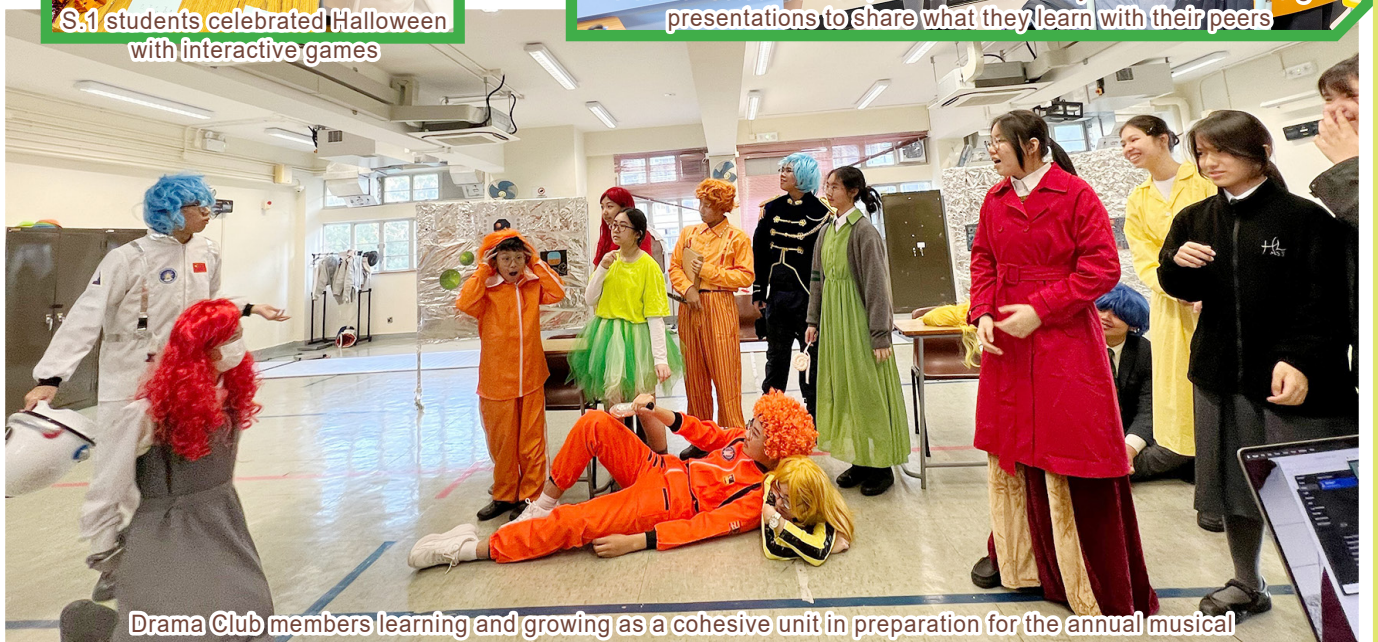
Drama Club members learning and growing as a cohesive unit in preparation for the annual musical