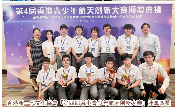
香港新一代文化協會「第四屆香港青少年航天創新大賽」連奪四獎