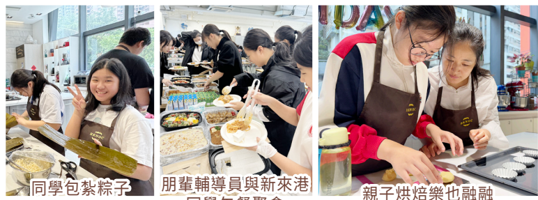
同學包紮粽子 得心應手