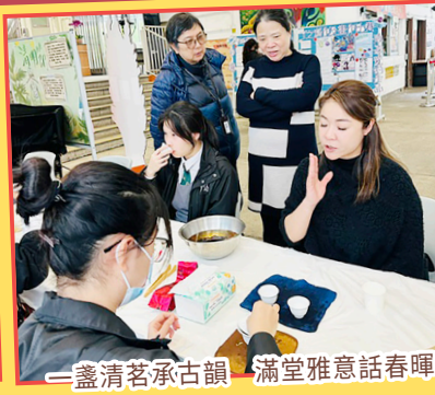
一盞清茗承古韻 滿堂雅意話春暉