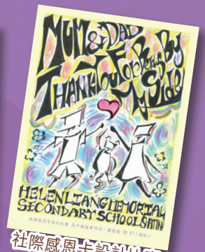
社際感恩卡設計比賽 高中組冠軍 5D 蕭哲瑜 (綠社)