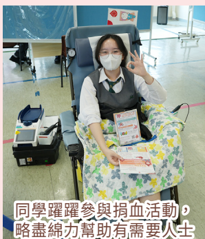
同學躍躍參與捐血活動，略盡綿力幫助有需要人士

一年一度的「捐血日」又來臨了，同學和老師付出寶貴的時間踴躍參與捐血活動，為病人帶來痊癒的希望。「捐一次血，救三個人」，我們期待與您一起參與別具意義的捐血活動。