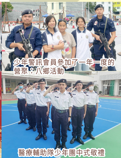
少年警訊會員參加了一年一度的營聚：八鄉活動