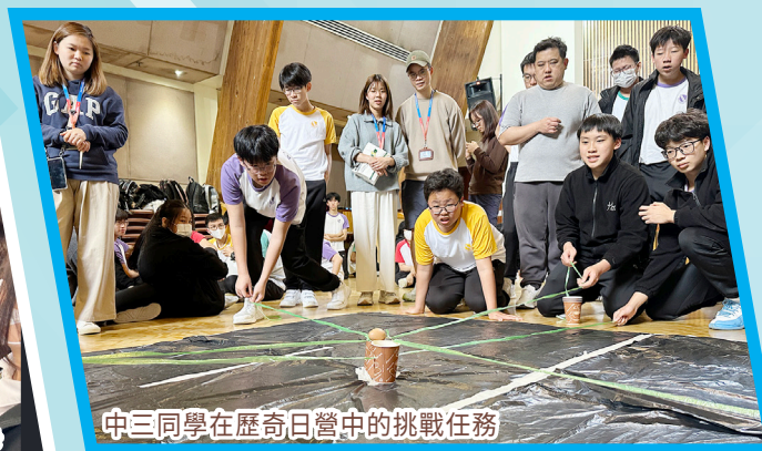
中三同學在歷奇日營中的挑戰任務