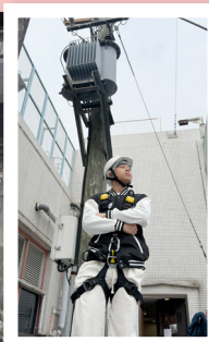
學生認識中華電力有限公司架空天線系統