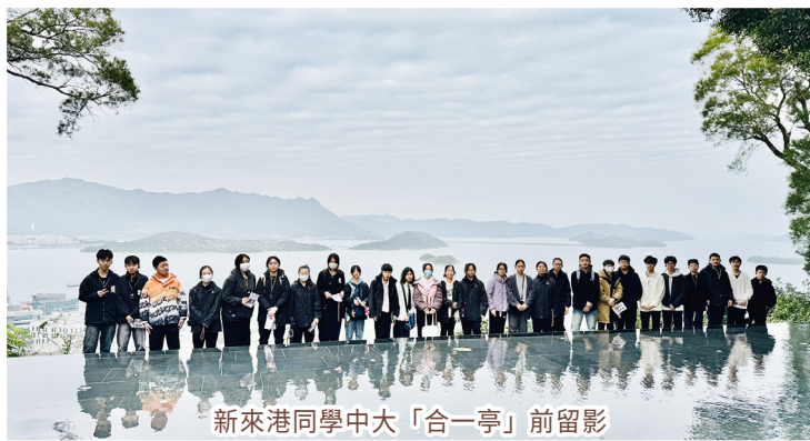
新來港同學中大「合一亭」前留影